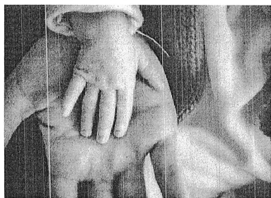
Трагедия в Купчино: от чего погибла двухлетняя девочка?