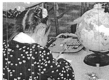
Что ученик пятого класса сделал с первоклассницей